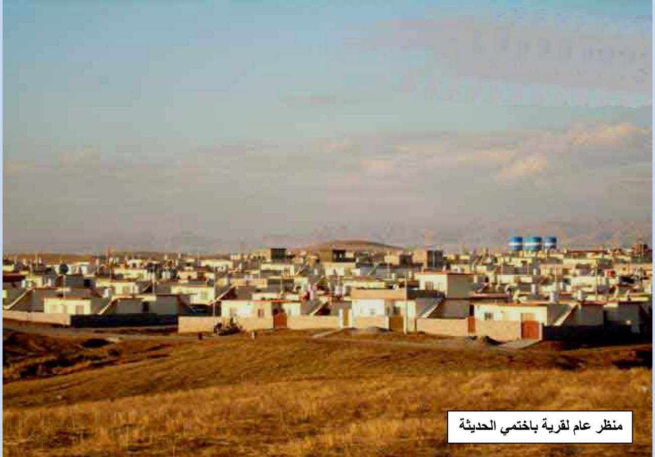
منظر عام لقرية باختمي الحديثة