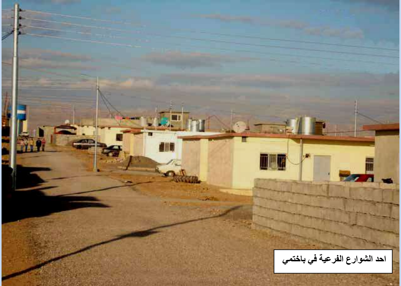
احد الشوارع الفرعية في باختمي