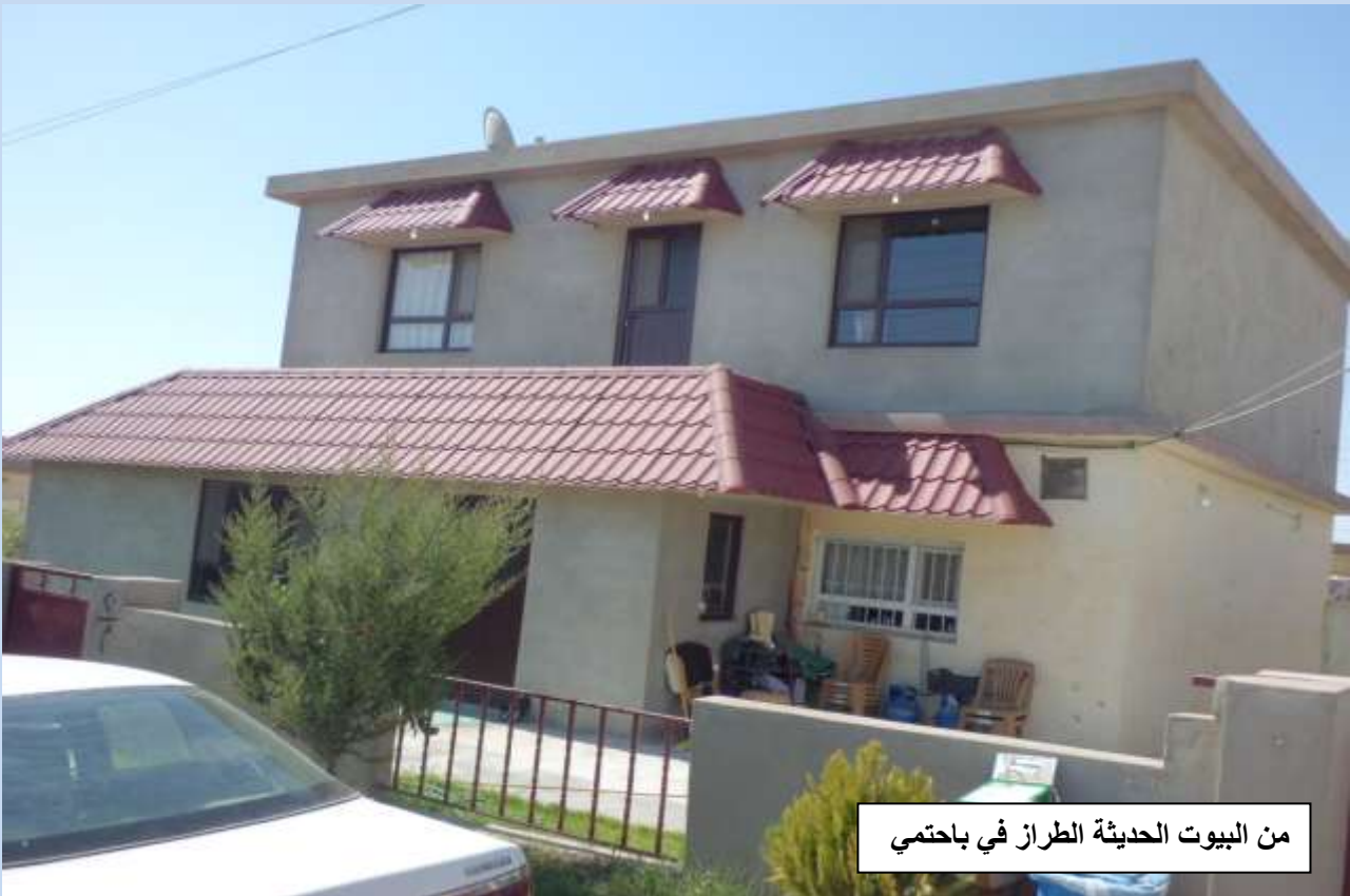
من البيوت الحديثة الطراز في باحتمي

وبعد سقوط النظام الطاغي الدكتاتوري في بغداد في نيسان عام ٢٠٠٣. شرعت حكومة اقليم كوردستان بالاهتمام بابناء الشعب الكوردستاني فقام الاستاذ سر كيس اغاجان وزير المالية في حكومة الاقليم بمشروع عظيم لا مثيل له وهو بناء جميع القرى المرحلة لأبناء شعبنا الكلداني السرياني الاشوري، عن طريق تشكيل لجان خاصة بشؤون المسيحيين. وفي عام ٢٠٠٧ قامت اللجنة العليا لشؤون المسيحيين في محافظة دهوك برئاسة السيد فرنسو عوديشو مندو، هذا الرجل القوي الصبور المعروف بحنكه الاجتماعي وبتواضعه واخلاقه الرفيعة في التعامل مع ابناء شعبه والاستماع الى ارائهم ومشاكلهم عن طريق عقد الاجتماع معهم ومد يد العون والمساعدة لجميع العوائل الفقيرة وسد كافة احتياجاتهم اليومية فكان حقا بمثابة الاب لهم. ومع تخصيص رواتب