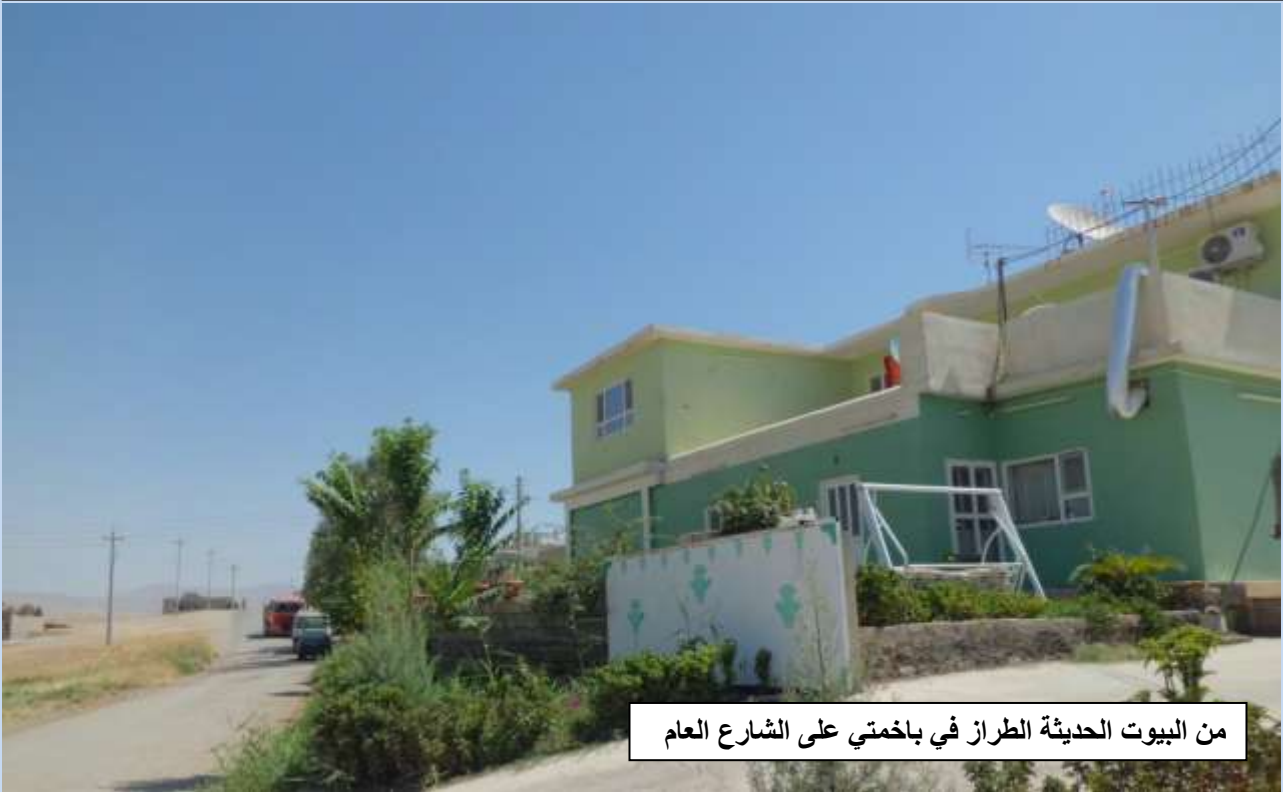
من البيوت الحديثة الطراز في باختمي على الشارع العام