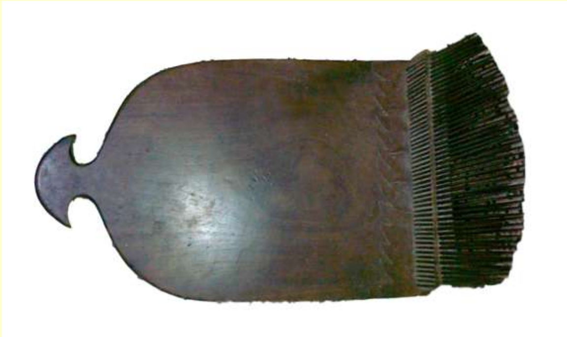
ماسرقا (تجهت توك)

أن الخيوط التي تصنع منها الملابس هي من شعر (جرا) وتسمى (مُجْدِي) وبالعربية يسمى (مرعص)، حيث يتم غسله في البداية بـ (الماء) وبعد ذلك يُنْفَش الـ (مُجْدِي)، وبعدها يقومون بعملية (المشط) (مُجْدَتِي) لتصفيته من الشوائب العالقة به.